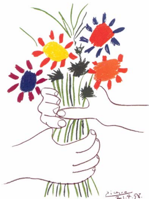
Pablo Picasso: Le Bouquet

Vielen Dank für Ihre Aufmerksamkeit und Ihr Interesse!